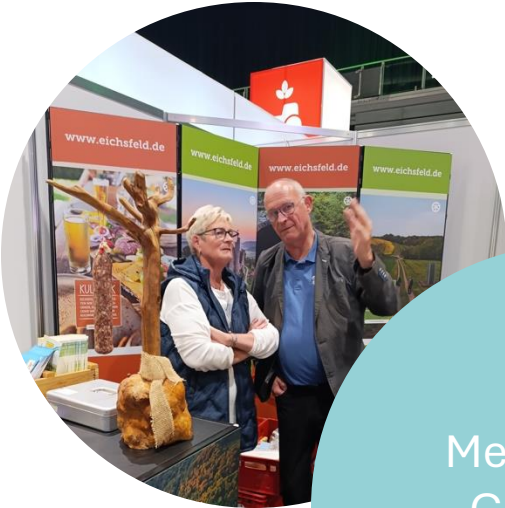
Messe Erfurt „Grüne Tage Thüringen“