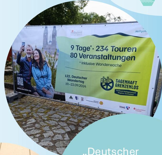
„Deutscher Wandertag“ als Auftritt für eine neue Wahrnehmung des Eichsfelds